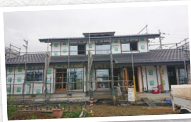
写真は施行中のものです