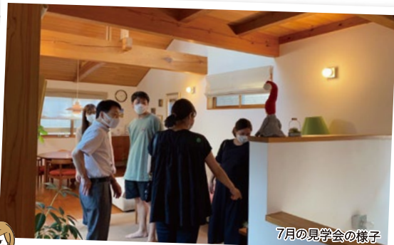
7月の見学会の様子